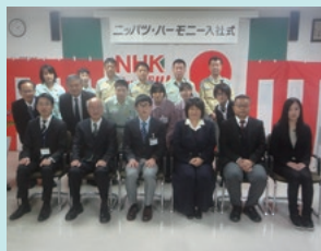
新入社員3人を迎えた滋賀営業所入社式

障がい者の特例子会社であるニッパツ・ハーモニーが、2017年4月、滋賀営業所を開所し、新入社員3人を迎えて業務を開始しました。西日本では初の営業所となります。