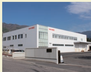
完成したメックの新棟

ニッパツ・メック（以下メック）が長野県駒ヶ根市にある駒ヶ根工場の増築に向け、2017年5月29日、地鎮祭を行いました。メック駒ヶ根工場は、かねて生産スペースなどが手狭になっており、中長期的な業容の拡大も視野に入れて隣接した土地に増築することになりました。2018年に新棟が完成し、5月17日、竣工式を行いました。