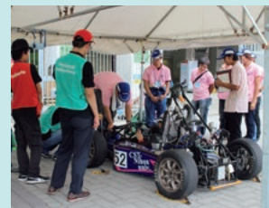
当社提供のばねが搭載された 学生自作のクルマ

当社は、毎年9月に開催される自動車技術会主催の「全日本学生フォーミュラ大会」に協賛・支援しています。大会協賛のほか、30を超える大学からダンパー用ばねの提供依頼があり、無償提供しました。前途有為な学生の活動を積極的に支援しています。