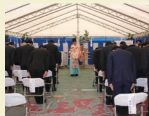
神事式で行われた安全祈願祭

2018年1月22日、長野県上伊那郡宮田村の工場新設予定地で、産機事業本部宮田工場新設に向けた安全祈願祭を行いました。宮田工場は、化成部品第二工場の敷地に新設するもので、伊勢原工場で生産している接合・セラミック部の半導体製造装置用部品の第2拠点となります。増産対応が急がれることから、建屋の一部と設備が整い次第、生産を開始し、順次、工場を完成させていく予定です。