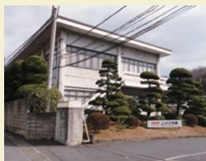
生産を開始したニッパツ水島

同社は現在、三菱自動車水島製作所内に新たな生産ラインの設置を進めており、今後順次、生産を移管させていく予定です。