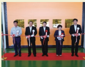
稼働を開始したニッパツ九州

2016年8月、ニッパツ九州が、西日本の自動車メーカー各社の方々などを招き、開所式を行いました。懸架ばね事業の西日本の新たな拠点として、海外輸出なども視野に入れた事業を展開していきます。