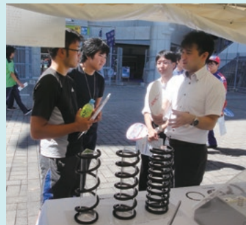
大会ではブースに出展し、当社をPR