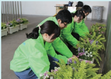
横浜事業所：公園の清掃活動とともに行った緑化の支援

当社グループは、各地で、その地域に応じた貢献活動を行っています。当社本社のある横浜事業所では、昨年に続き、休日を利用して、当社がネーミングライツを契約する「ニッパツ三ツ沢球技場」のある三ツ沢公園とその周辺の清掃活動を行いました。今回は、横浜市が進めていた「全国都市緑化よこはまフェア」に協賛し、同球技場を花で飾るなどの支援を行いました。