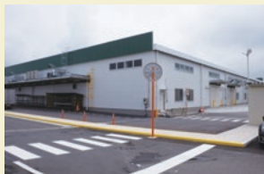
完成した新ウレタン棟

群馬工場の新ウレタン棟が完成し、2016年6月、竣工式を行いました。工場再構築に伴い、ウレタン生産の新ラインも敷設しました。品質および生産性のさらなる向上につながるものと期待されます。