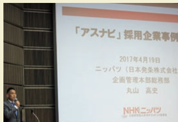
アスナビ採用企業事例発表