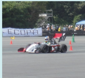
当社提供のばねが搭載された学生自作のクルマ

当社は、毎年9月に開催される自動車技術会主催の「全日本学生フォーミュラ大会」に協賛・支援しています。学生が自作するクルマで競うこのイベントに、大会協賛のほか、各大学からの依頼に基づき、主にダンパー用のばねを無償提供しています。2017年度は、さらに新たな大学からの依頼も受け、これに対応しています。前途有望な学生の活動を積極的に支援しています。