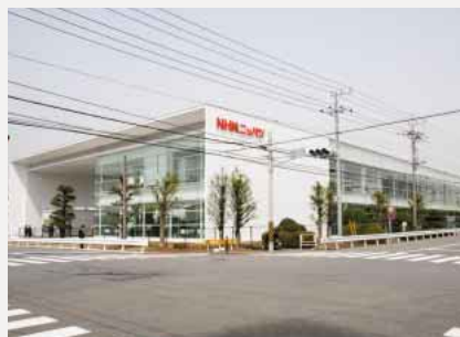
厚木工場新事務棟