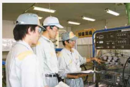
「ものづくり伝承塾」で基礎を学ぶ

そのほか、滋賀工場「行動館」を皮切りに各工場で開催している工場内の訓練施設では、それぞれの工場の状況に合わせた道場を設け、安全、品質、環境保全など、具体的な訓練でものづくりの基本を習得しています。