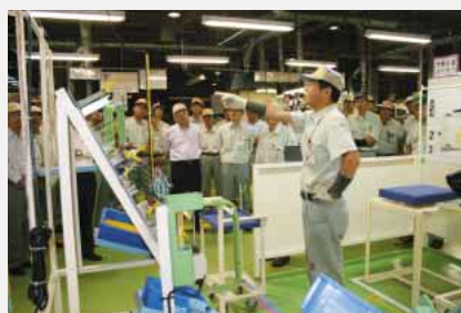
実際の作業に必要なルールや知識・行動を習得するエリアを工場内に設置。シート横浜工場の「訓練広場」