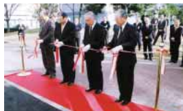
12月7日、当社幹部と工事関係者が出席して行われた竣工式