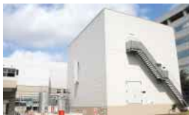
稼働を開始したコージェネレーション設備

横浜事業所のコージェネレーション設備が完成し、2004年12月から稼働を開始しました。クリーンな天然ガスを使用し、自社での発電と廃熱利用により、いっそうの省エネルギーが進みます。原油換算で10%の省エネルギーを見込んでいるほか、CO 2 排出量も15%削減できます。また排熱は、シートの生産、懸架ばねの塗装処理、冷温水の供給、冷暖房などに使用します。