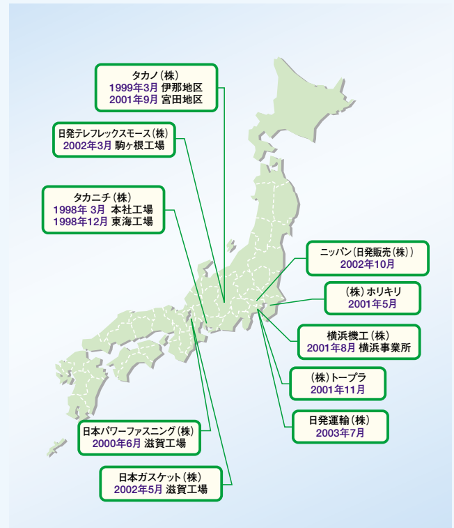
国内関連会社のISO14001認証取得の時期

社会的要請に応えるため今後とも積極的な認証取得をめざし、また当社においても未取得の国内関連会社に対して積極的に支援してまいります。