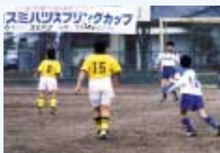
青少年のスポーツ振興を積極的に後押し