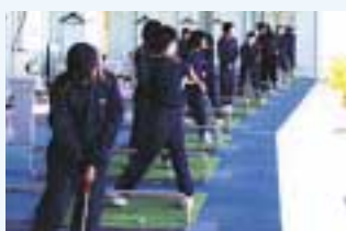
中学卒業生を招いての体験ゴルフ