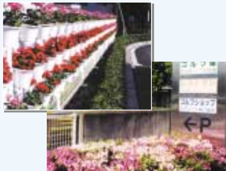
季節ごとに美しい花が咲く ジー・エル・ジーの構内

当社の国内関連会社29社はISO14001認証取得活動に限らず、清掃活動や省エネルギー活動など、多岐にわたった環境保全活動を実施しています。