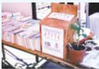
古本の販売を行い、 収益金は社会貢献活動に利用している

国内関連会社各社では、周辺の美化活動や地域行事への参加などを行っています。地域と密着した企業として、従業員全員で社会貢献活動を積極的に推進しています。